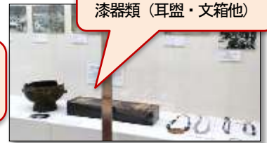
アイヌ文化に欠かせない漆器類(耳盥・文箱他)