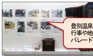
登別温泉地区の地域行事や地獄まつりのパレードの様子