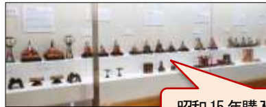
昭和15年購入の雛人形一式