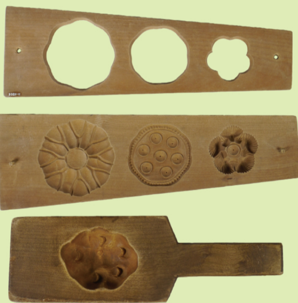
■ 幌別にあった菓子店「ポニカ」で使っていた菓子木型（ハス、ジャガイモ） [昭和40年代]