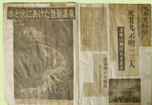
■ 登別温泉の水害をまとめた切り抜き [昭和36年]