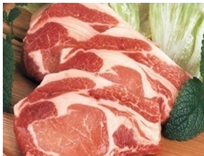
《写真》 のぼりべつ豚ロース