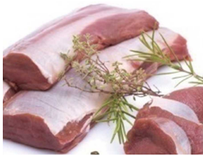
《写真》 エゾシカ肉ロース