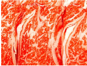
《写真》 登別牛肩ロース