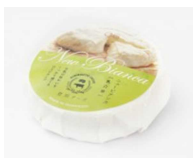
《写真》 登別チーズ ニューピアンカ