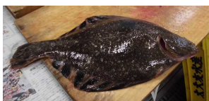
《写真》 提供例 マツカワカレイ