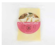
《写真》 登別チーズ ヌプリベツ