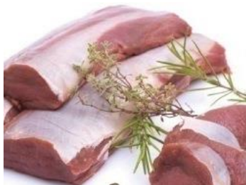
《写真》 エゾシカ肉ロース