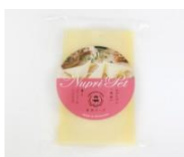
《写真》 登別チーズ ヌプリベツ