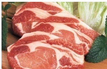
《写真》 のぼりべつ豚ロース