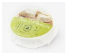
《写真》 登別チーズ ニューピアンカ