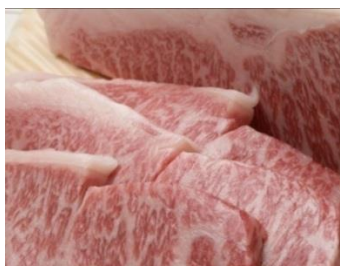
《写真》 登別牛サーロイン