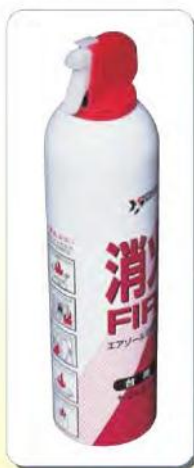
■対象商品(自主回収) 【ヤマトボーイKT】

弊社では、これまで皆様のご協力を得て自主回収を推進してまいりました。しかし、今年で製造から10年が経過しておりますが、まだ多数の消火具が残っている可能性が高く、事故防止を図る観点から、今後とも皆様方のご協力を得て一層の回収・廃棄に努めてまいります。