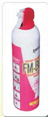
■対象商品(自主回収) 【FMボーイK】