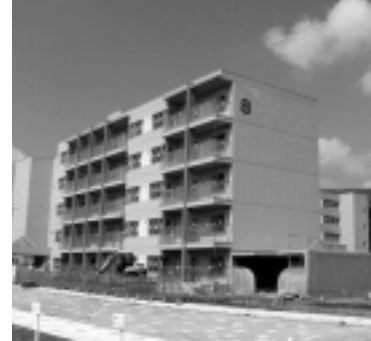
▲完成した桜木団地8号棟