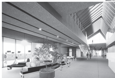
▼内観イメージ図の一部