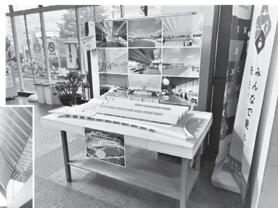
▲公開している新庁舎完成予想模型