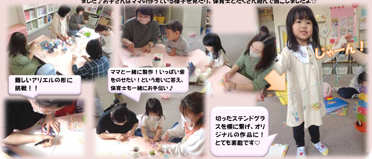
難しいアリエルの形に挑戦！！

今月のはぐっこは『スタンドグラス製作』でした！これから雨も多くなりますが、そんな日でも窓のスタンドグラスを見ると気分が上がりますね♪はぐっこはママのための癒やしの時間♡1時間近く集中して製作するママもいました♪お子さんはママの作っている様子を見たり、保育士とたくさん遊んで過ごしましたよ☆