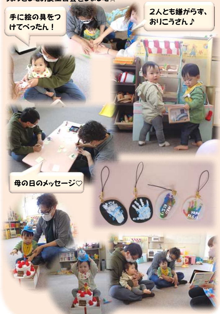
手に絵の具をつけてべったん！

13日(土)はお父さんとあそぼう！もう少しで母の日ということで手形&足形のストラップ製作！ママとパパでおそろいです♡さらに、今回参加してくれた男の子2名とも5月生まれで1歳なりたて！後半にちょっとしたお誕生日会をしました☆