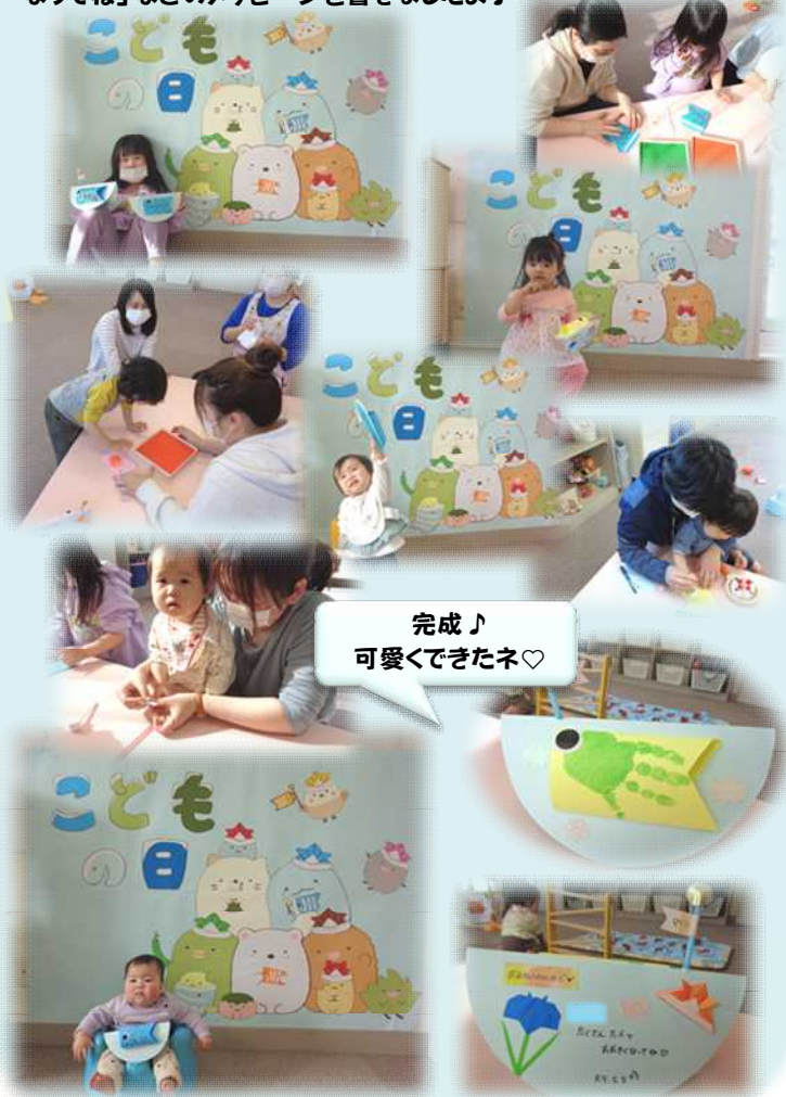
完成♪ 可愛くてきたネ♡

5月1日はこいのぼりの製作をしました！こいのぼりには指スタンプで模様をつけましたよ！小さなお子さんは手形でも！とても可愛い作品になりました♡裏面にはママからお子さんへ「いっぱい食べて大きくなってね」などのメッセージを書きましたよ！