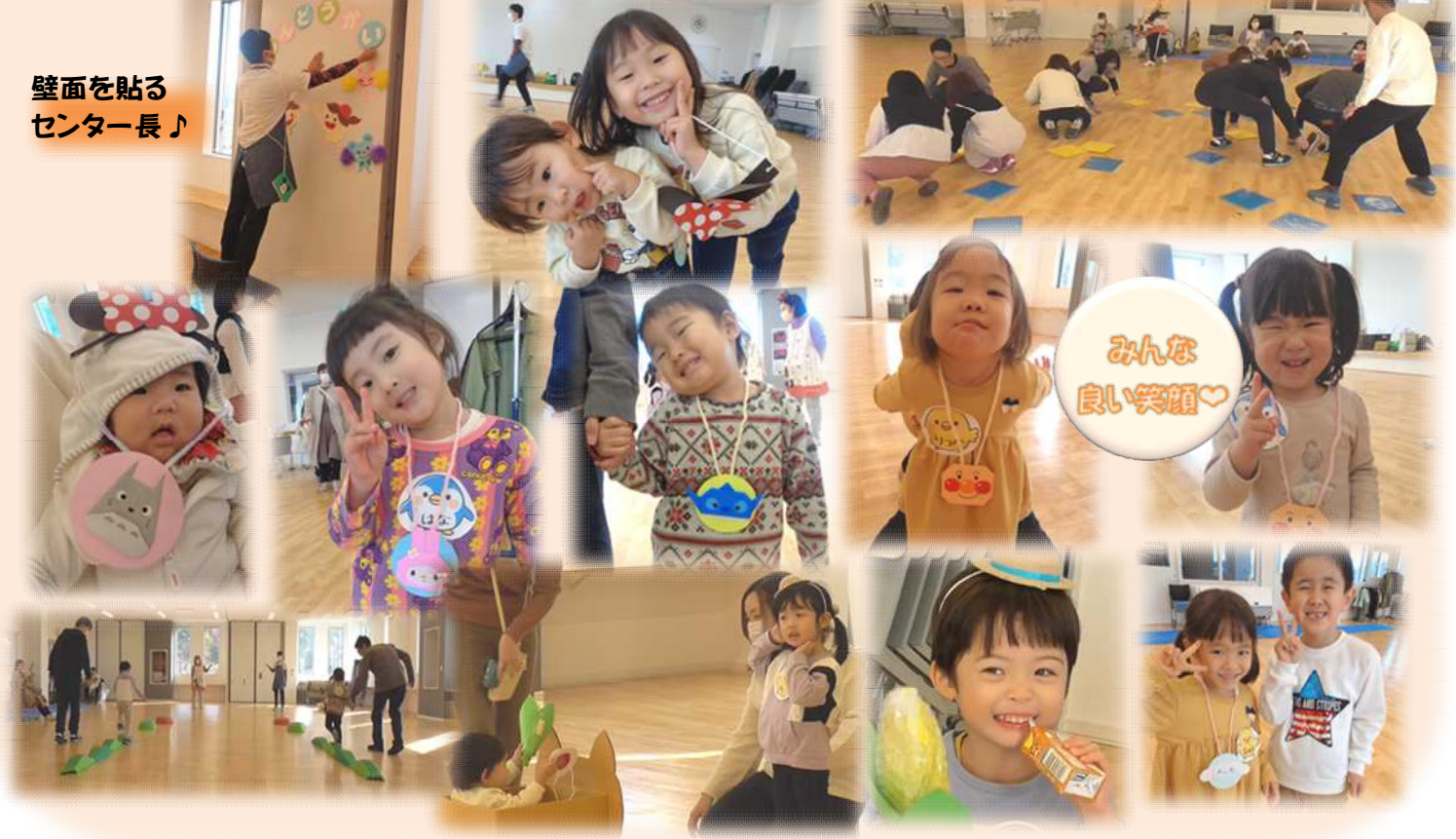
壁面を貼る センター長♪

11月11日(土)はセンター初のミニ運動会でした！徒競走や親子競技、玉入れなど子どもたちは笑顔で参加♪悔し涙を流すお友達もいましたが、最後には笑顔で終わることができました☆閉会式では「まだやれたかった！」この声も上がり、職員一同とても嬉しく思います。皆様、ご参加ありがとうございました！ 大人たちによる、オセロゲーム！！