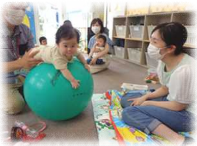
お父さんとあそぼう