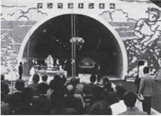
▲『フンベ山トンネル』の開通式

登別漁港近くのフンベ山にある『フンベ山トンネル』が開通したのは、平成2年9月5日。