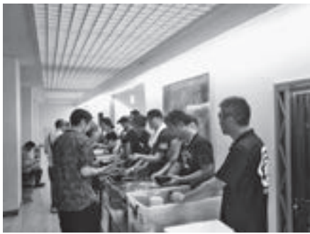
▲『平成30年北海道胆振東部地震』発生後に市が開設した避難所で、炊き出しを行う市民の有志

地震による直接的な被害は少なかった当市においても、停電による影響は大きく、市民生活に大きな支障をきたしましたが、地域住民の町内会をはじめとするさまざまな市民活動団体や事業所に加え、自衛隊などの公的機関、そして、人情味