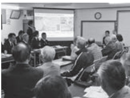
▲協働のまちづくりに重要な情報共有の場の一つである地区懇談会（写真は2018年10月富久寿園）

その前年となる今、私たちはこの大きな機の一つのきっかけとし、将来につながるまちづくりに取り組んでいかなければなりません。本年は、その機をしっかりと活用し、備える年として、『暮らしの安全を守り、安心を実感できるまちづくり』『災害への備え』『年齢や性別を超え、誰もが健やかに暮らし、未来が輝くまちづくり』『未来の福祉への備え』『ふるさとの資源を活用した、活力と賑わいあふれる魅力あるまちづくり』『経済活性・外貨獲得への備え』の3つの柱を軸に、議員の皆さん、市民の皆さんの一層のご理解とご協力をいただきながら、市政に取り組んでいきます。