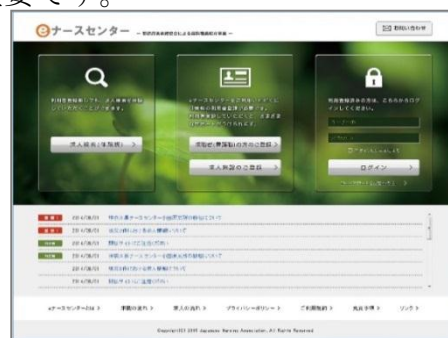
新「e ナースセンター」のトップ画面

新たな e ナースセンター は、スマートフォンへの対応や、求職の際の入力項目を大幅に減らすことなどで幅広い年代に利用しやすくし、看護職が誰でも簡単に自分で仕事を探すことができるようになりました。病院などの求人側にとっても、登録の簡略化や応募方法の追加により、利便性が向上します。